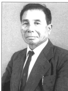
Taira Shinken (c. 1965)

Lamentavelmente, Anbun foi morto na batalha de Arakaki, Makabe em Shimajiri-gun em 20 de Junho de 1945. Ele tinha 59 anos. O túmulo de Anbun está localizado na Província de Chiba.