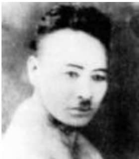
SHINKO MATAYOSHI (1888 – 1947)