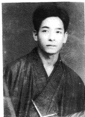
CHIBANA CHOSHIN (1885-1969)

Itosu dedicou a vida inteira em restabelecer o karate da linhagem Shuri-te herdada de Matsumura Sokon e o fez florescer maravilhosamente por transmiti-lo às gerações posteriores.